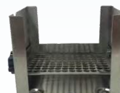
для микропланшетов (одиночных или в стопке)