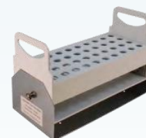
для пробирок (модифицируемый угол наклона)